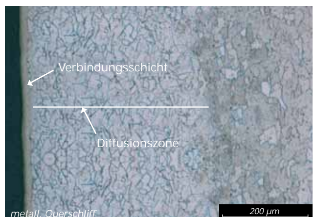
Gefügedarstellung einer plasmanitrierten Randschicht.